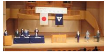
※写真は、過去の学位記授与式の様子です。