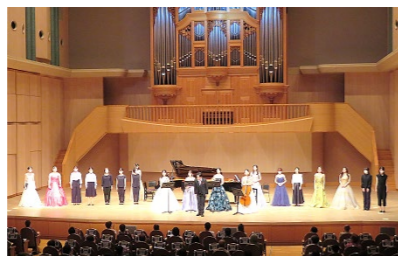
【オータムコンサートの写真】

第1部は大阪音楽大学専攻科生によるオータムコンサート、第2部はダルビッシュセファット ファルサ氏を講師に迎え、特別講義「日本文化を学ぶということ」を行いました。